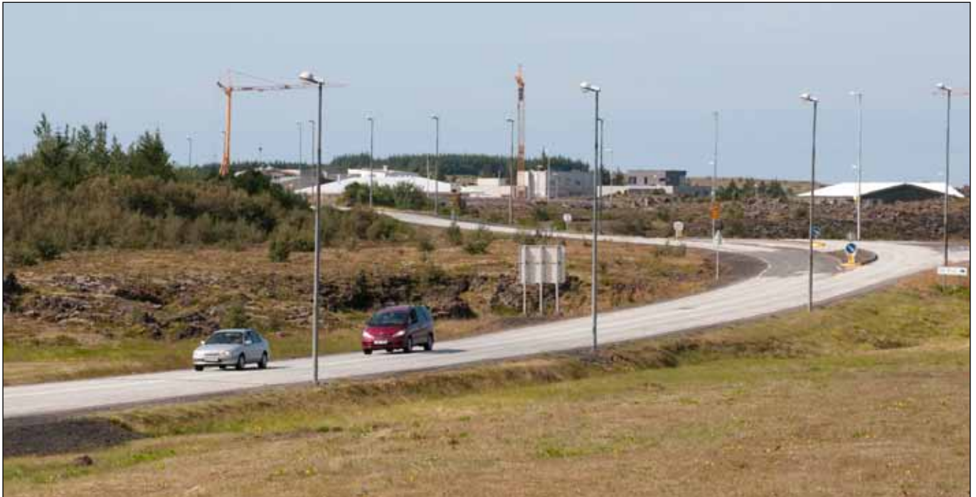
Álftanesvegur í Engidal.