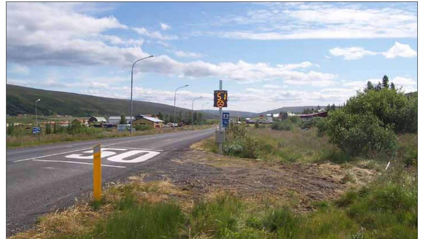
Radarinn hefur mælt bíl á 51 km/klst. þar sem aðeins er leyfður 50 km/klst. hraði. „Broskarlinn“ sýnir skeifu :-)

Reykjavíkurborg mun leiða vinnu við stígagerðina í nánú samráði við Vegagerðina. ■