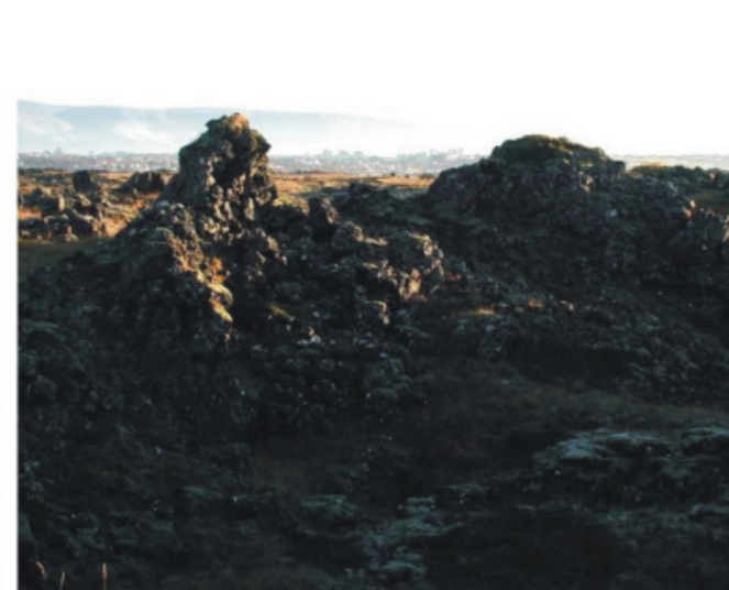
Mynd nr. 15 í skýrslu um mat á umhverfisáhrifum Álftanesvegjar frá 2002.