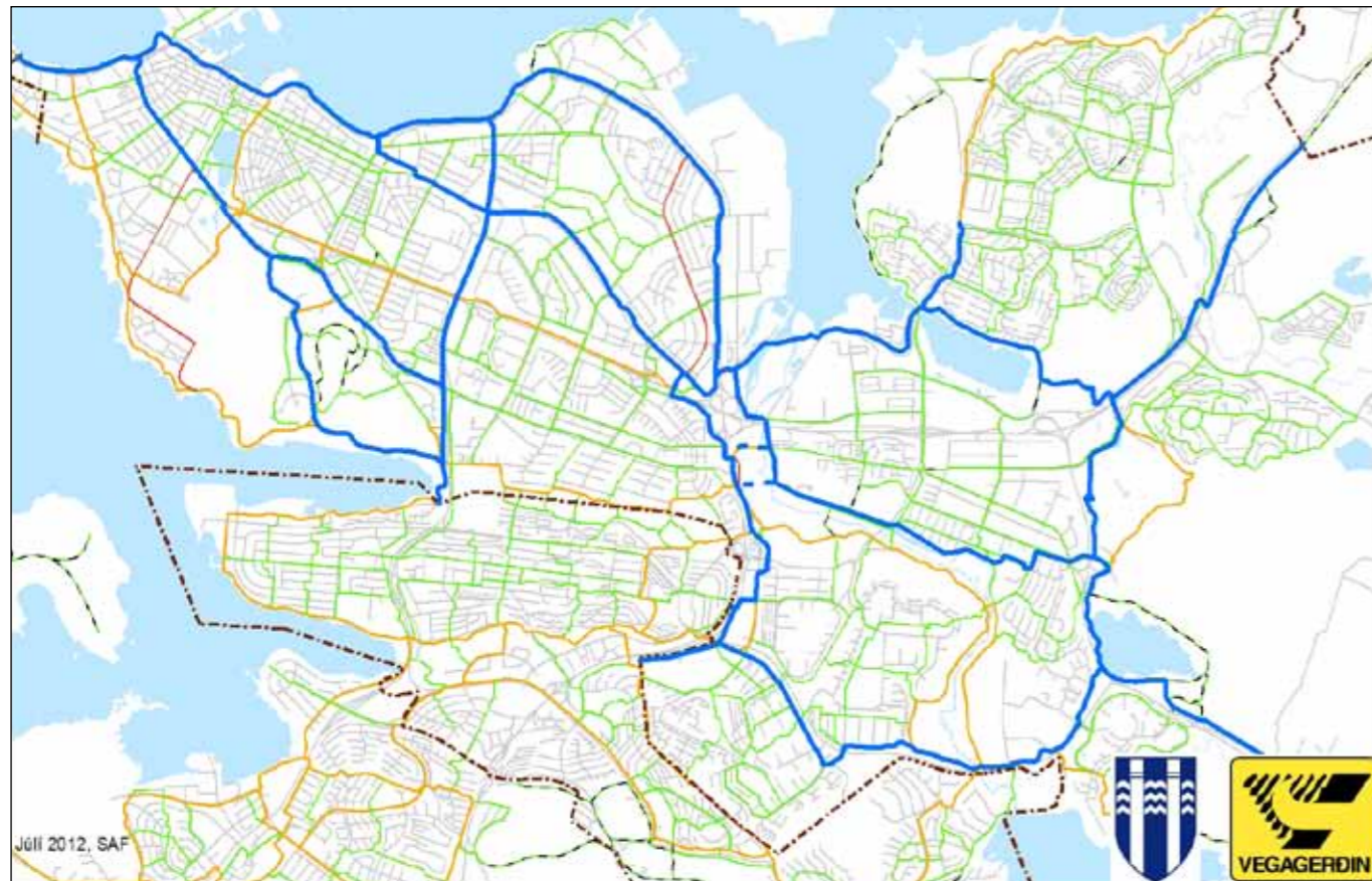
Stígar í Reykjavík, styrktir af Vegagerðinni.

tengjast nýjum brúm sem verða lagðar yfir Elliðaárósa í samræmi við samkeppni sem Reykjavíkurborg og Vegagerðin stóðu sameiginlega að. Þeirri vinnu verður lokið á næsta ári. Þá er í gangi vinna við stíga meðfram Vesturlandsvegi, framhá Keldum og að Mosfellsbæ. Þeirri stígalagningu líkur í ár.