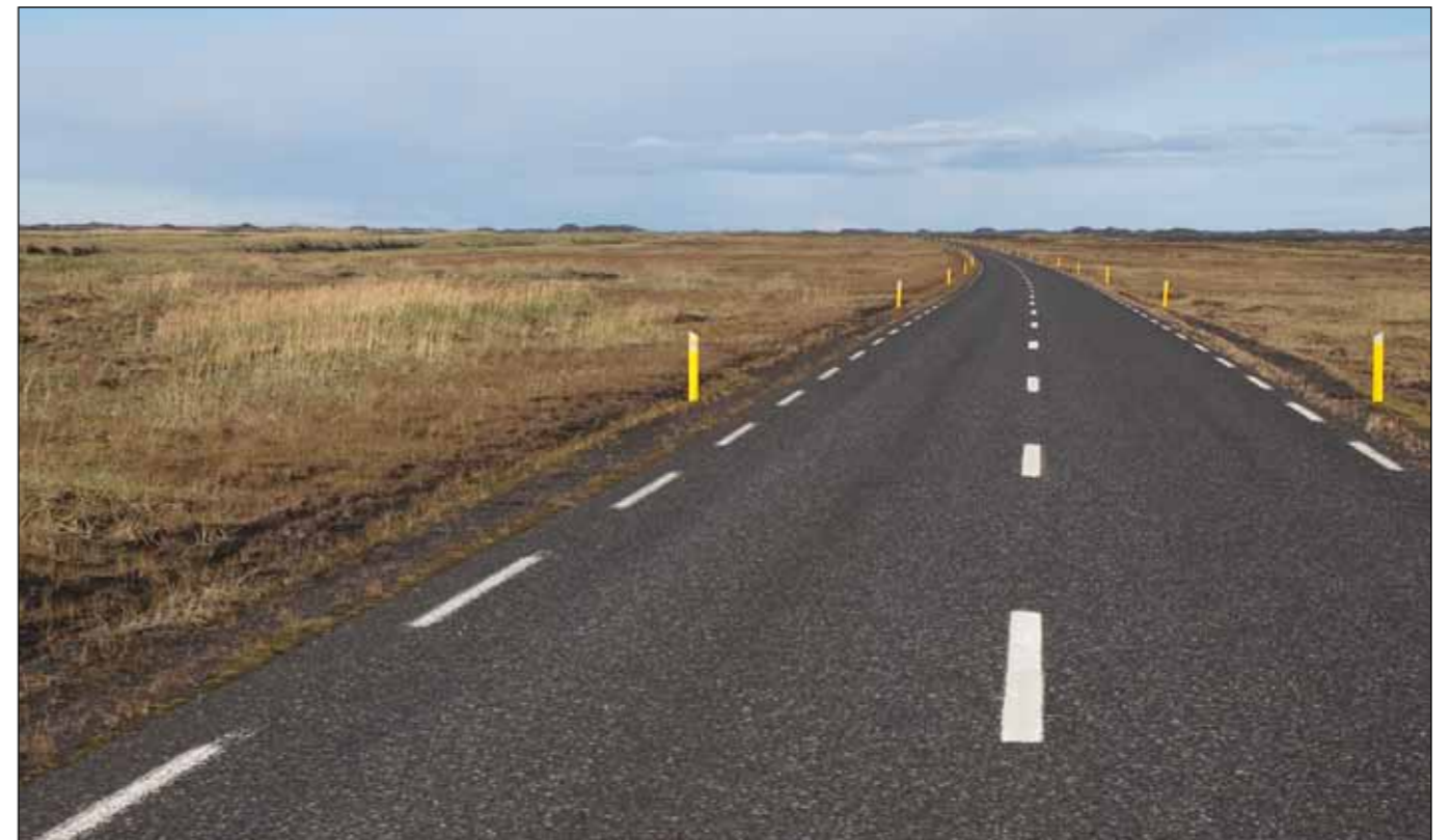
Hringvegur (1) liggur lágt í landinu á Mýrdalssandi og því var ekki pláss fyrir sver (há) rör fyrir Dýralæki.